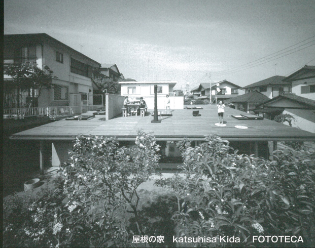
屋根の家