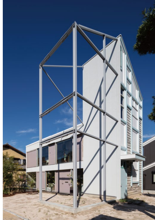
TETUSIN DESIGN RE-USE OFFICE