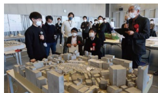
昨年の審査の様子

参加校：信州大学工学部・上田情報ビジネス専門学校・長野工業高等専門学校・長野県池田工業高等学校 長野県飯田 OIDE 長姫高等学校・長野県上田千曲高等学校・長野県長野工業高等学校