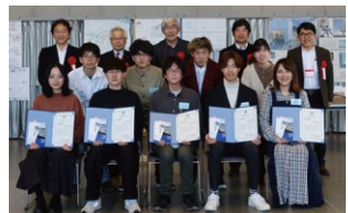
昨年の大学の部・審査員と参加学生