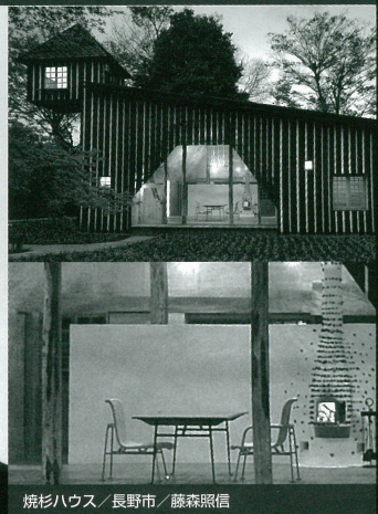
杉形ハウス/長野市/藤森照信