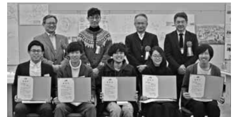
卒業設計コンクール